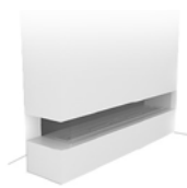
LEFT FRONT / RIGHT FRONT