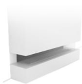
LEFT FRONT RIGHT